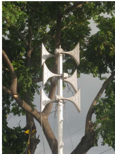
Schulung und Einweisung